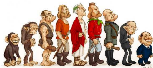
"L'Ortica" '09 - "Homo Ridens: Tributo semiserio a Charles Darwin" - Primo premio © Marco Martellini